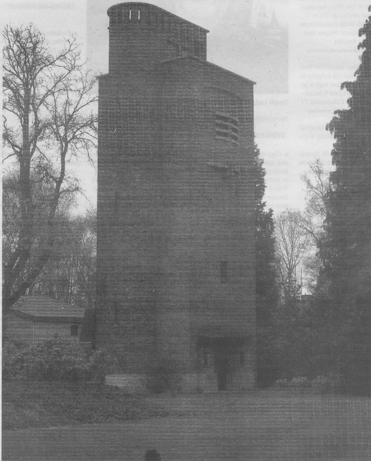
De eigenaar van de uit 1938 daterende watertoren in Doorwerth wil het gebouw opnemen in een op te richten woon/werkplek.