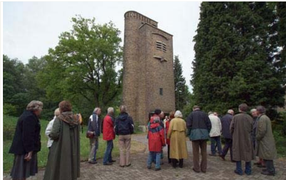
Belangstellenden voor het waterbeheer in Doorwerth bekijken de oude watertoren uit 1938.

Maandag, 14 mei 2007 - DOORWERTH - Hemelwater, rioolwater, regenwater, kwelwater, afvalwater, drinkwater; buiten regende het, binnen kwamen zaterdag al deze soorten vocht voorbij. Hoe komt water uit de kraan? En hoe wordt hemelwater opgevangen.